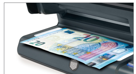
Grande area LED a luce bianca per verificare filigrana, filo metallico e microstampe