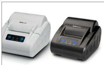
Stampante termica Safescan TP-230 N. art.: 134-0475 grigia N. art.: 134-0535 nera