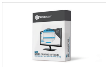
Software Safescan MCS N. art.: 124-0500