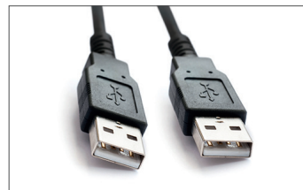
Cavo USB Safescan N. art.: 124-0458