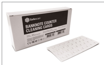
Salviette di pulizia Safescan N. art.: 152-0663