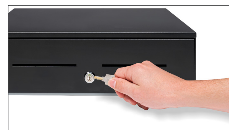
Con serratura in 3 posizioni (bloccata, stand-by e aperta)