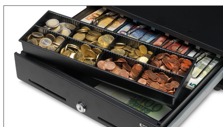
Vassoio rimovibile per 8 diverse monete