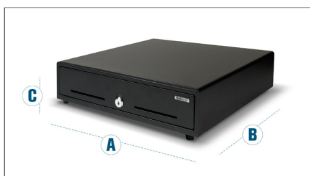
Dimensioni: A: 35 cm - B: 40.5 cm - C: 10.5 cm