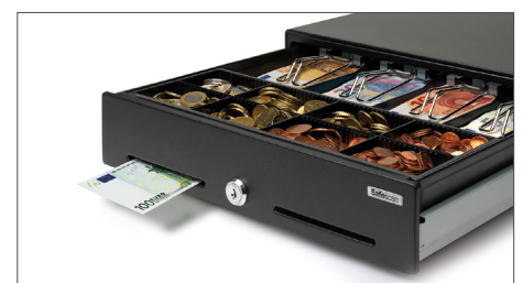
Fessura di separazione per il deposito di banconote di grande taglio e valori